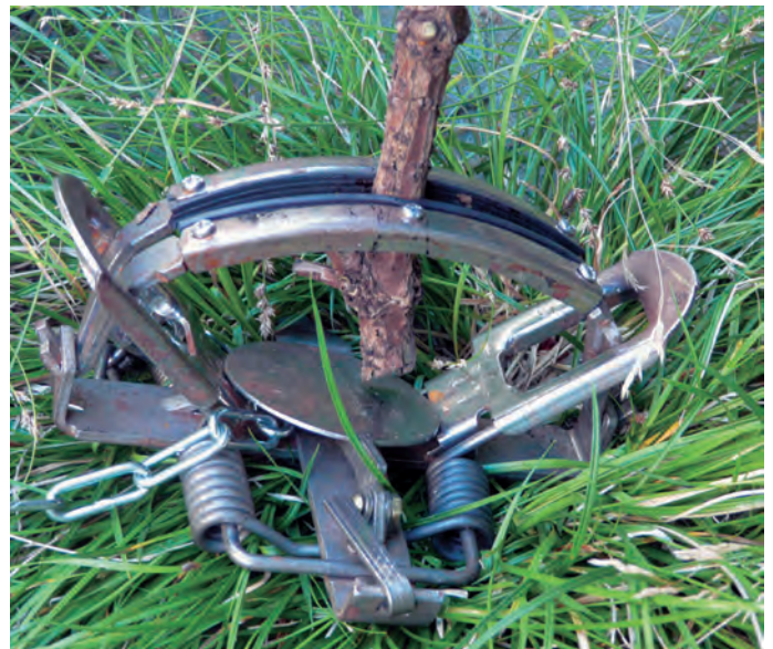
Piège à mâchoires moderne.